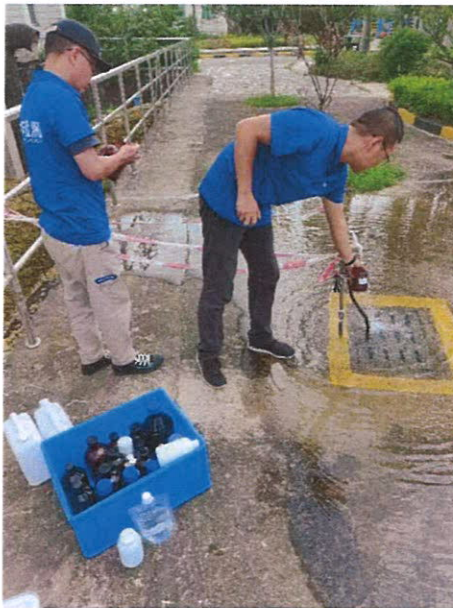
图 1：第二水厂出厂水采样口