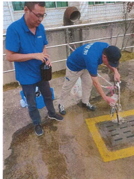
图 2：第二水厂出厂水采样口