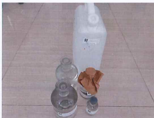
鹤山北控水务四堡水厂出厂水样品