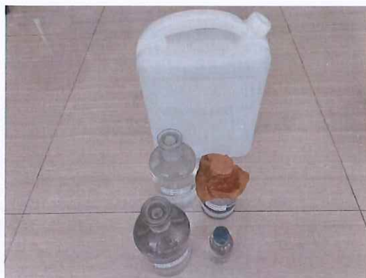
鹤山北控水务四堡水厂出厂水样品