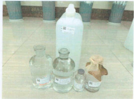
鹤山北控水务第二水厂出厂水样品