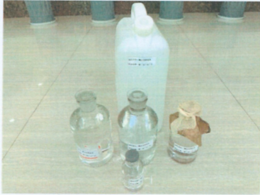
鹤山北控水务第二水厂出厂水样品