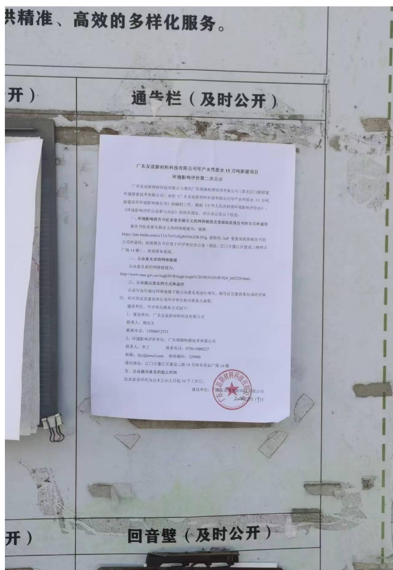
图 3-4 先锋村信息张贴公示