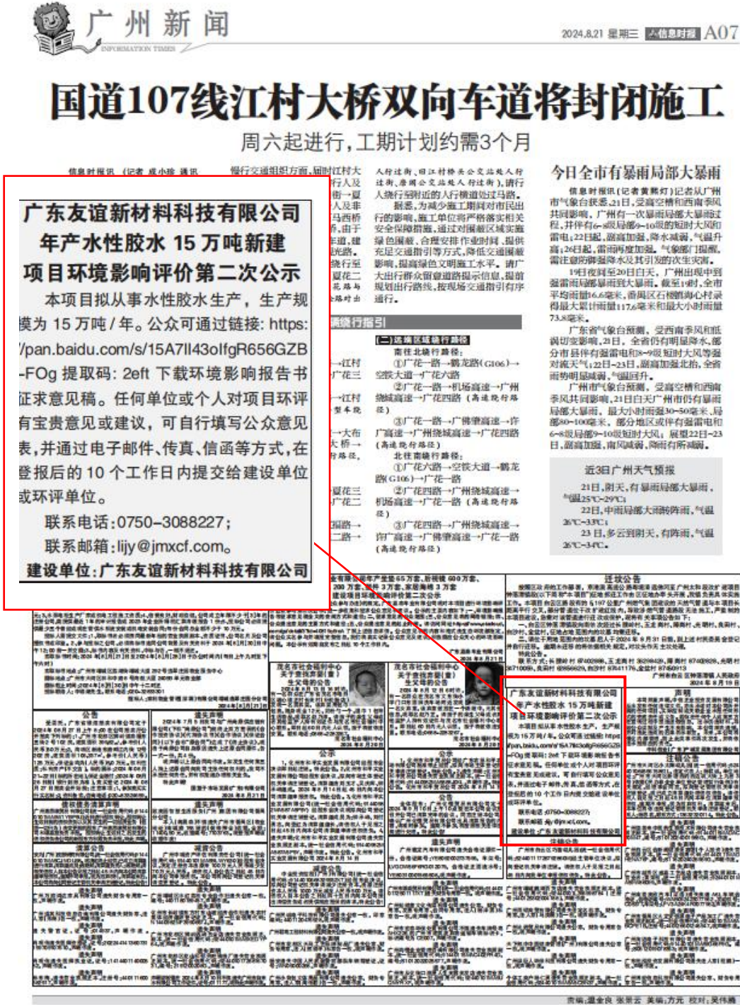
图 3-2 (1) 第二次环保公示报纸公示 (2024 年 8 月 21 日)

第二次环保信息公示在《环球时报》报刊上发布了2次，时间分别为2024年8月21日、8月23日。符合《环境影响评价公众参与办法》要求的第二次环保公示发布2次报纸公示的要求。2次报纸公示的截图见图3-2。