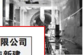
广花城际全线首个盾构区间隧道双线贯通

信息时报讯（记者 戚小珍 通讯员 林佳 张胤牧 郭伟）随着“铁兵广花88号”盾构机破壁而出，广州东至花都天贵城际项目（下称“广花城际”）首段明挖段至盾构线路所盾构