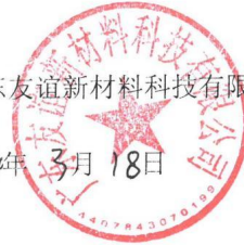
图 2-1 环评委托书