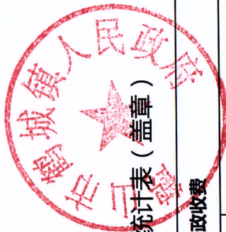
鹤城镇（部门）2018年度行政征收实施情况统计表（盖章）